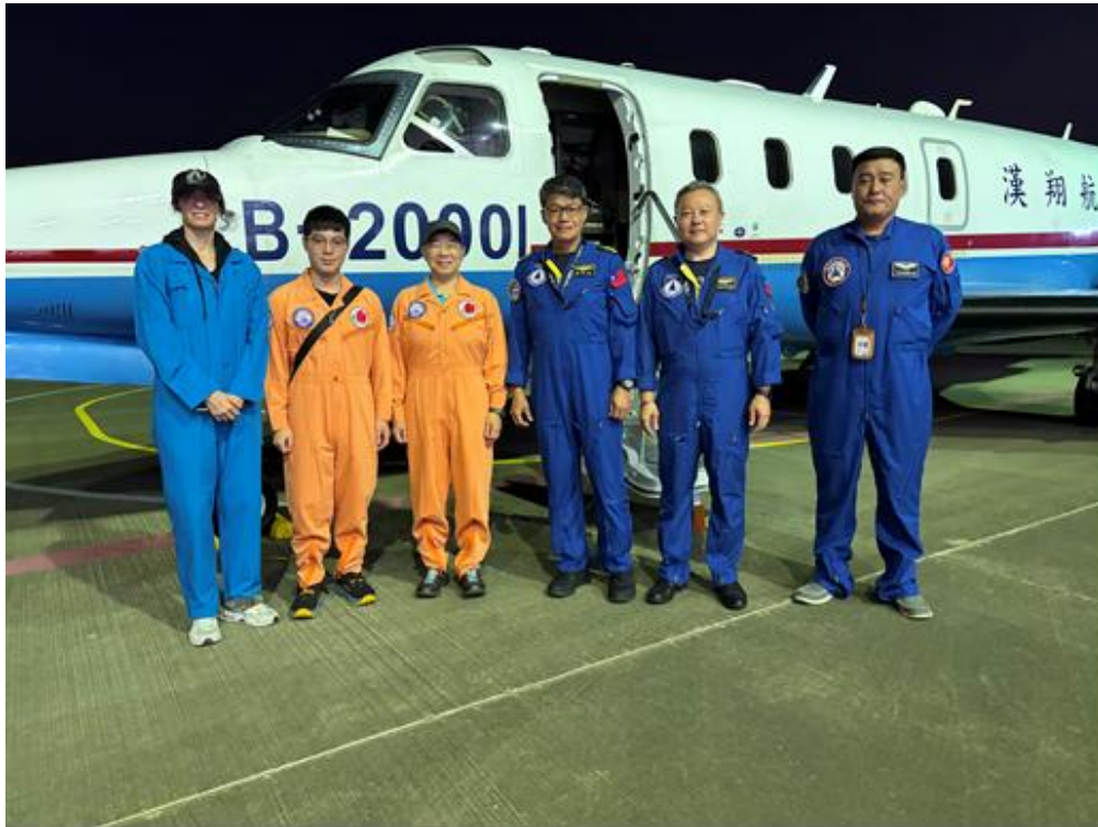
附圖 1、2026 年 7 月 10 日今日清晨追風計畫團隊執行飛行任務登機前合影。